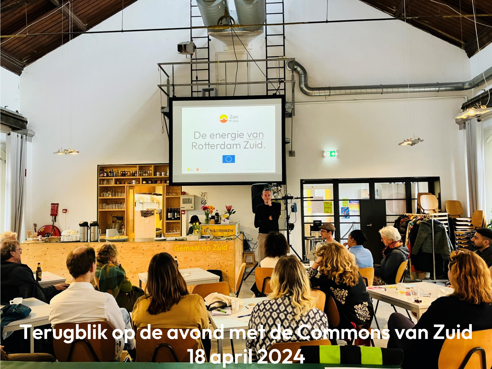
Terugblik op de avond met de Commons van Zuid 18 april 2024